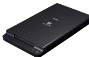
DIN A4-Flachbett-Scaneinheit 102

Scannen Sie Bücher, Zeitschriften und empfindliche Medien mit der optionalen Flachbett-Scaneinheit 102 (bis DIN A4) oder der Flachbett-Scaneinheit 201 (bis DIN A3). Einfach per USB angeschlossen, arbeiten diese Flachbettscanner nahtlos mit dem DR-C225 II (ausschließlich) zusammen und ermöglichen die Anwendung aller verfügbaren Funktionen zur Bildverbesserung.